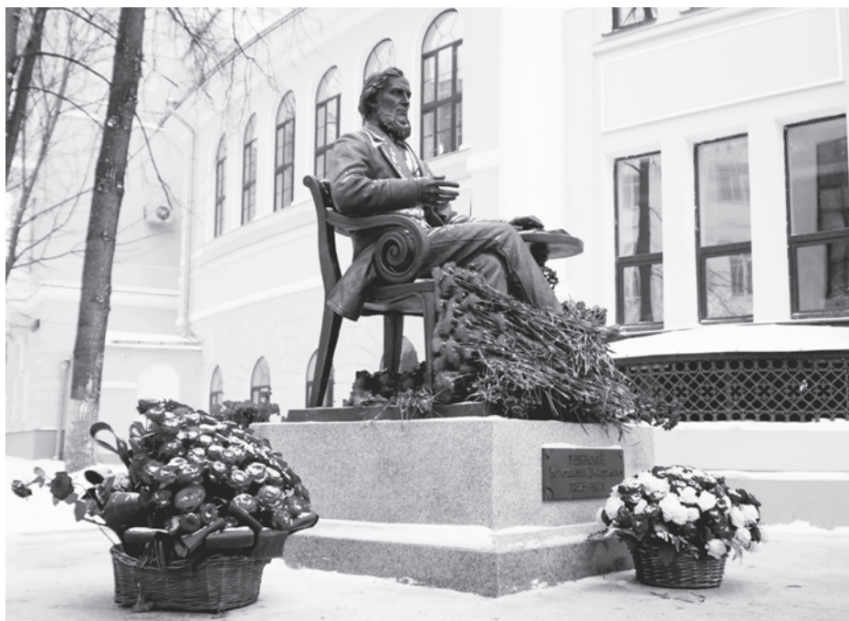
Памятник К. Д. Ушинскому возле главного корпуса Московского педагогического государственного университета. Открыт к 200-летию великого педагога 20 февраля 2023 года

Одна из ранних записей в дневнике молодого Ушинского свидетельствует о том, как он сам видел свой жизненный путь. «В поте лица, в пыли презрения, под знойными лучами пекущего солнца, рискуя жизнью, бросать семена в землю, зная, что никогда не увидишь жатвы, и всё-таки работать до конца жизни... Труднейшая, бесславнейшая доля в массе трудов человечества — лучшая доля, величайшая доля!»