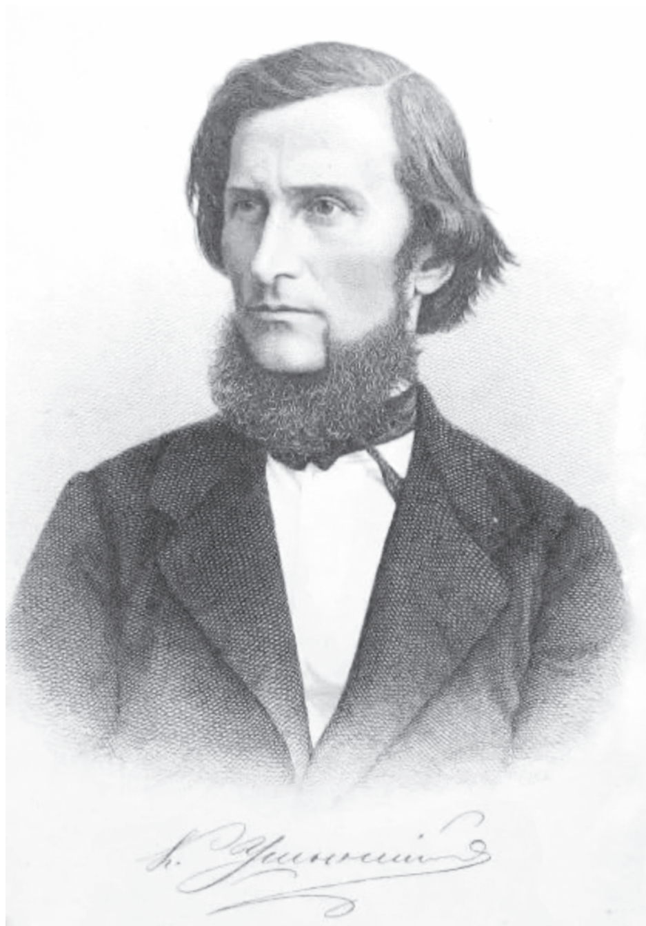
Константин Дмитриевич Ушинский 1823 – 1870