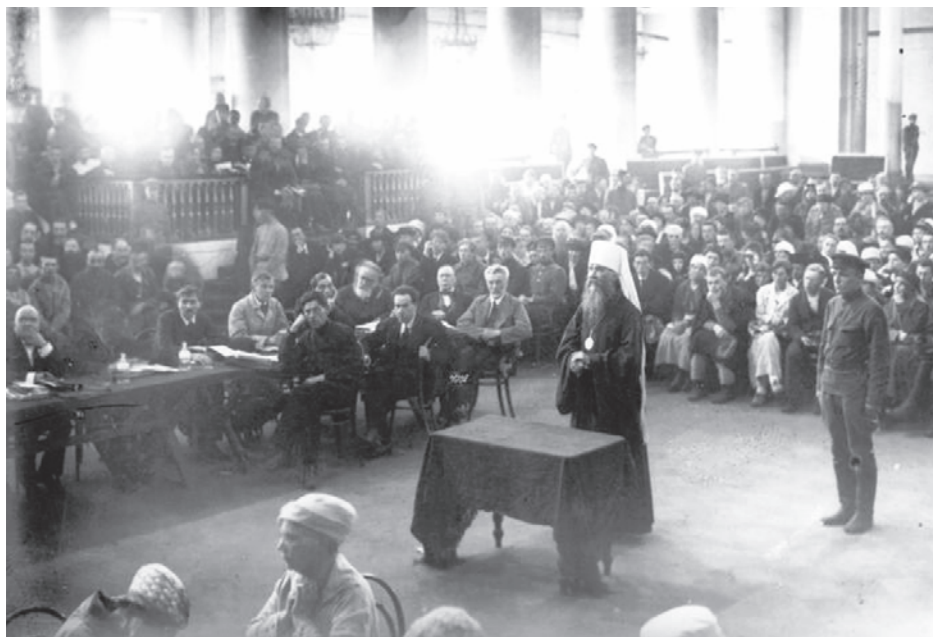
Слово митрополита Вениамина на процессе.

их полную невиновность. Тогда председатель суда сказал: «Вы всё говорили о других, трибуналу желательно знать, что же вы скажете о самом себе?» — «О себе? — в раздумье повторил митрополит. — Что же я могу вам ещё сказать о себе? Разве лишь одно...» Он минуту помолчал и затем при глубокой тишине притихшего зала спокойно сказал: «Я не знаю, что вы мне объявите в вашем приговоре — жизнь или смерть; но что бы в нём ни провозгласили, я с одинаковым благоговением обращу свои очи горé, возложу на себя крестное знамение и скажу: слава Тебе, Господи Боже, за всё!»