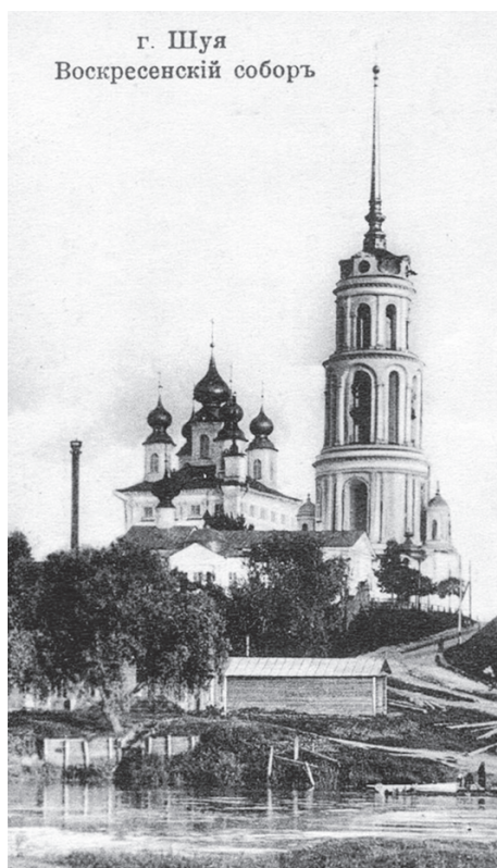
г. Шуя Воскресенский соборъ

В понедельник, 13 марта 1922 года, великопостная служба в Воск-