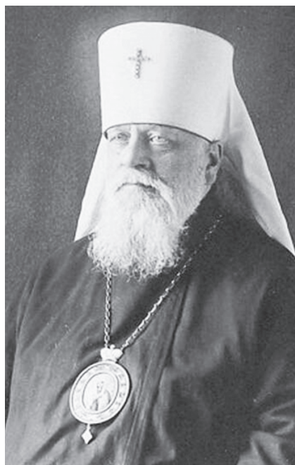
Митрополит Серафим (Чичагов)

В 1898 году, после смерти жены, отец Леонид принял монашеский постриг с именем Серафим, был определён для служения в Троице-Сергиеву лавру, а через год — в суздальскую Спасо-Евфимиеву обитель, став её настоятелем, с последующим посвящением в сан архимандрита. Написал житие преподобного Евфимия Суздальского. В 1904 году отец Серафим получил назначение на должность настоятеля Воскресенской Ново-Иерусалимской обители. В следующем году в Успенском соборе