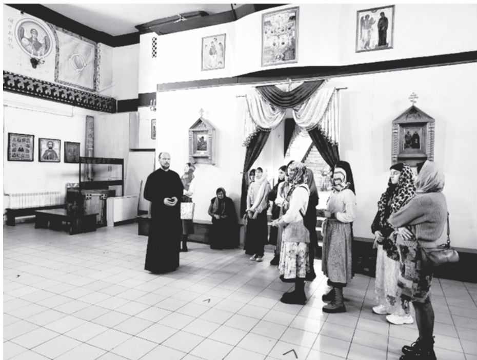
Экскурсия участников конференции в храм во имя Михаила Архангела