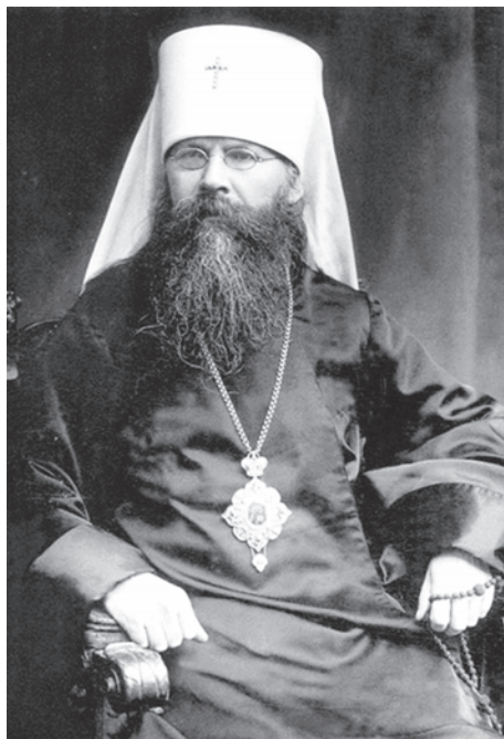
Митрополит Петроградский Вениамин

«Петроградской правды» (от 22 апреля 1922 г.) по этому поводу говорилось: «Изъятие церковных ценностей в пользу голодающих проходит в Петрограде при исключительно спокойной обстановке. Население и духовенство — в особенности рядовое — в вопросе помощи голодающим определённо стали на сторону мероприятий советской власти. Высшее духовенство во главе с митрополитом Вениамином (несомненно, под давлением низшего духовенства) также вынуждено было уступить и даже заключило соглашение с Помголом и послало в Комиссию по изъятию ценностей своих представителей».