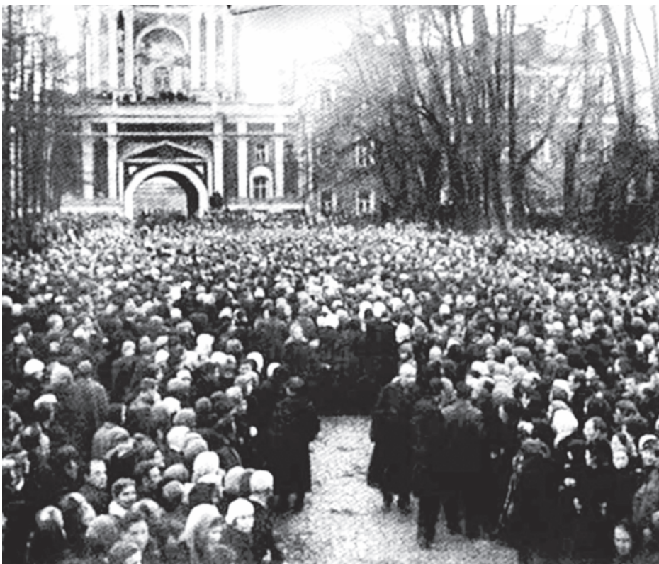
Погребение Патриарха Тихона

Академик Н. Н. Покровский в книге первой «Политбюро и Церковь. 1922—1925 гг.» писал: «Менее чем за два года Патриарху удалось сорвать мартовский 1922 года план Политбюро и ГПУ по навязыванию обновленчества Церкви и в дальнейшем — её разгрома. Одни за другими приходы и епархии Русской Православной Церкви стали возвращаться под омофор её соборно избранного главы».