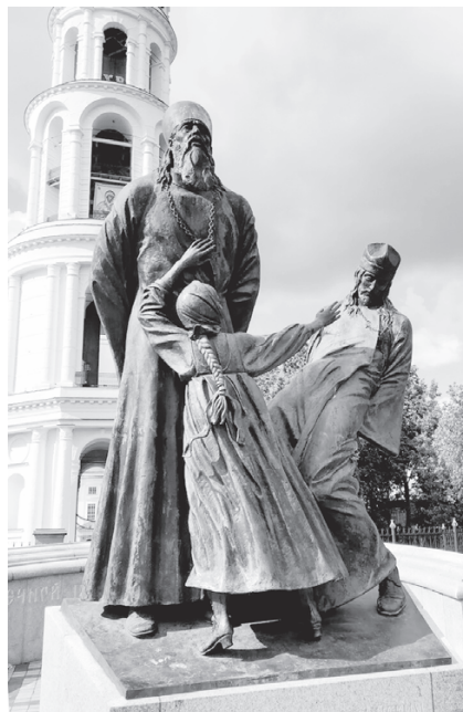
Памятник новомученикам Шуйским возле Воскресенского собора

После расстрела верующих у стен Воскресенского собора в Шую начались массовые аресты. Обвинение в сопротивлении изъятию церковных ценностей было предъявлено четырём священникам, в том числе настоятелю Воскресенского собора протоиерею Павлу Светозарову и священнику Крестовоздвиженского храма села Палех Иоанну Рождественскому.