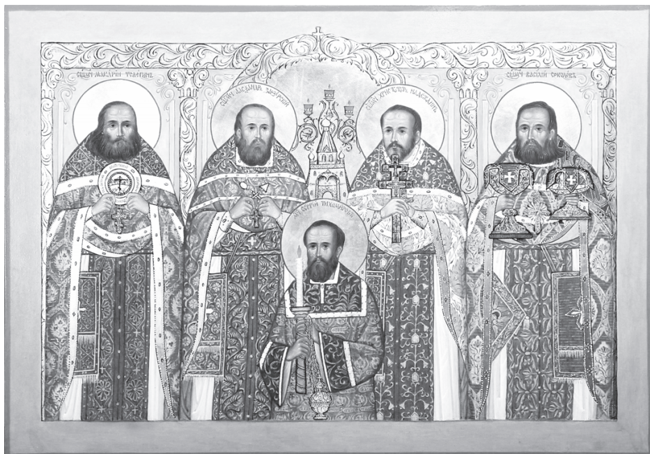
Икона священномучеников московских

храмы. Круг людей, допущенных к нему, был строго ограничен. Так чекисты добились полной изоляции Патриарха от дел церковного управления.