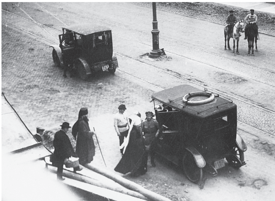
Митрополит Вениамин садится в тюремную машину. Архивное фото

А 15 июня сразу после отъезда машин с подсудимыми толпа, собравшаяся перед зданием суда, в том числе и случайные прохожие, была оцеплена сотрудниками ГПУ, которые погнали её затем пешком в ГПУ на Гореховой. После допросов большая часть задержанных была отпущена. Впоследствии сотрудники ГПУ арестовывали людей выборочно и тщательно следили за тем, чтобы в дальнейшем верующие не могли проникнуть в зал суда.