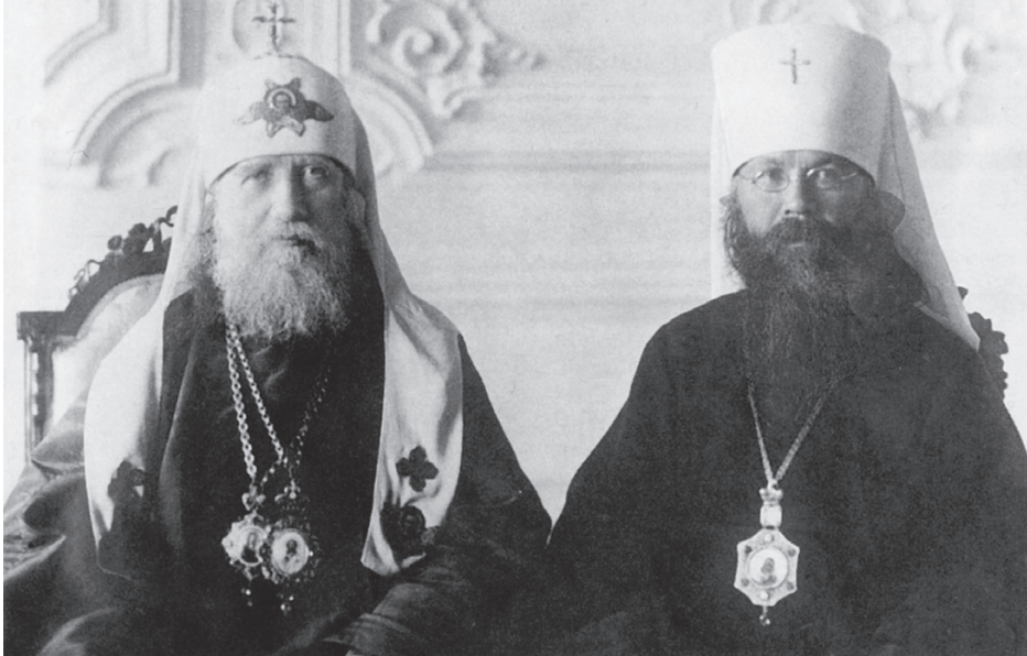
Святейший Патриарх Московский и всея России Тихон и митрополит Петроградский Вениамин (Казанский)

года. Как писал впоследствии протопресвитер Михаил Польский (1891 — 1960), «петроградское население огромным большинством (в том числе голосами почти всех рабочих) вотировало за Владыку Вениамина. Оно давно его знало и было глубоко привязано к нему за его доброту, доступность и неизменно сердечное и отзывчивое отношение к своей пастве и к нуждам её отдельных членов». Служение митрополита Вениамина после октября 1917 года, как и многих архипастырей и пастырей Церкви Христовой, было направлено на защиту православного народа России от жесточайших гонений, воздвигнутых на него богоборческой властью.