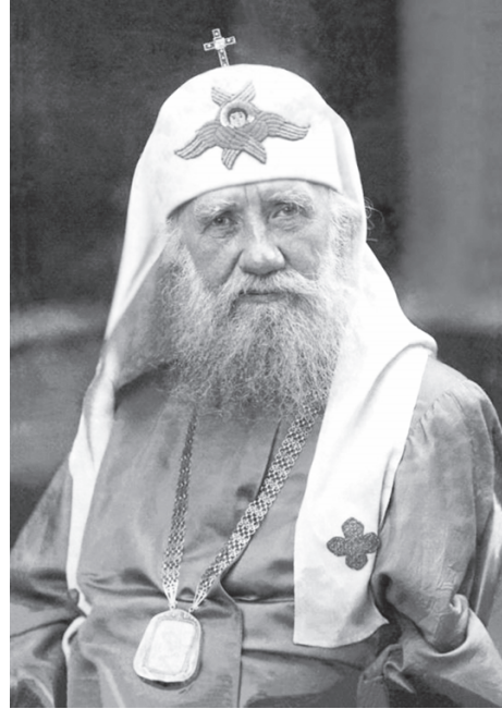
Святейший Патриарх Московский и всея России Тихон

Под контролем ВЦИК, во главе с М. И. Калинин, был сформирован Комитет помощи голодающим (Помгол). Довольно долго тянулись переговоры о том, может ли духовенство Русской Церкви принимать участие в деятельности этого комитета. 9 декабря 1921 года, когда голод принял угрожающие масштабы, власти наконец дали негласное согласие