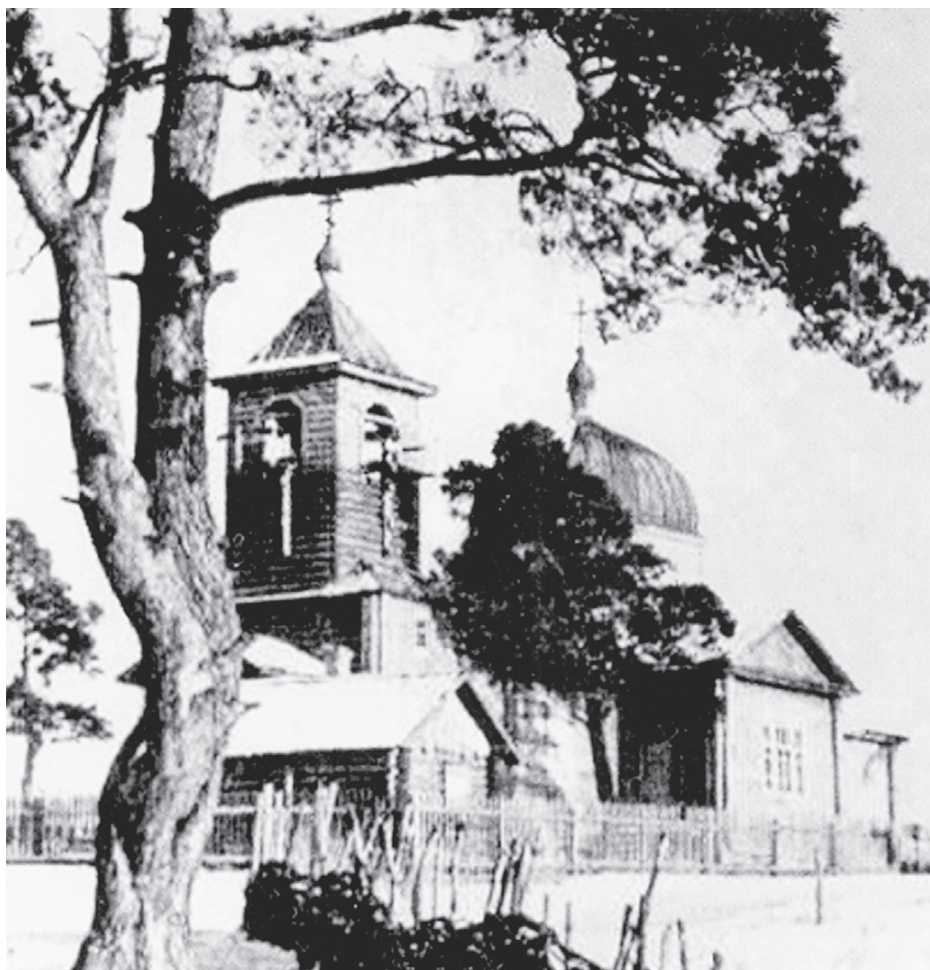
Вознесенская церковь (Туруханская), г. Новониколаевск. Фото 1913 года

Результаты кампании по изъятию церковных ценностей в Новониколаевской губернии были незначительны ввиду относительно небольшого количества ценностей в храмах. Губернские власти старались не обострять ситуацию и давали указания на места не чинить никаких репрессий по отношению к духовенству, пока ситуация не переходит в конфликтную.