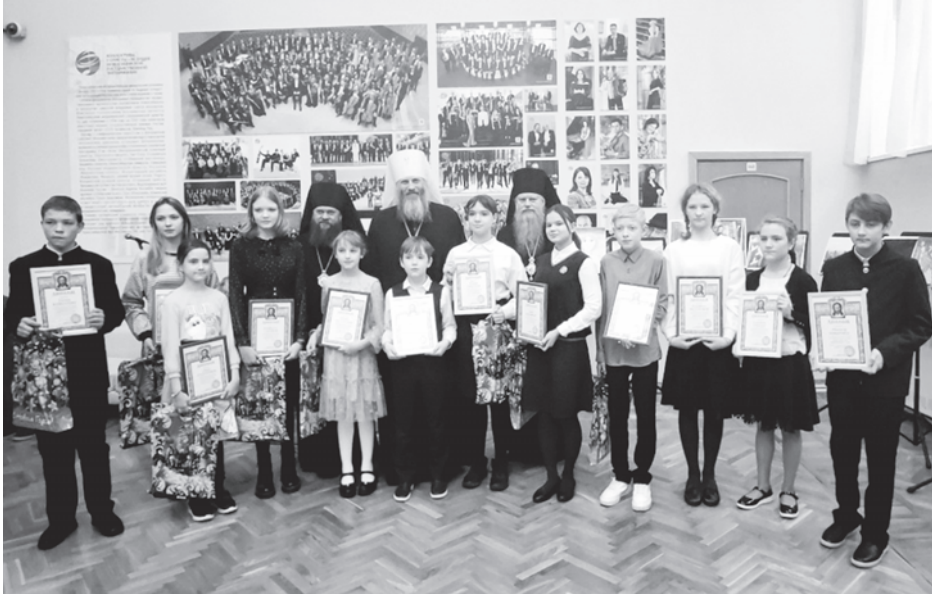
Награждение победителей и призёров регионального этапа XVIII Международного конкурса детского творчества «Красота Божьего мира»

Чтений запланировано множество различных мероприятий, круглые столы, конференции, семинары. Но важно то, что задан вектор — направление, по которому будут идти эти Рождественские Чтения. Сегодня подняты те вопросы, которые дают нам очень важные ответы, и эти ответы мы можем доносить потом до других людей, разъясняя им истину.