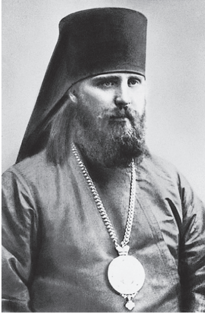
Архиепископ Иларион (Троицкий)

секретарём и консультантом по богословским вопросам. В мае 1920 года хиротонисан во епископа Верейского, викария Московской епархии. Назначен настоятелем Сретенского монастыря в Москве.