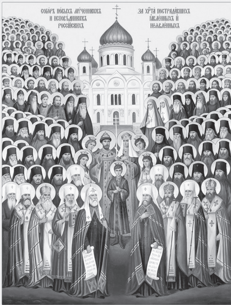
Икона Новомучеников и Исповедников Церкви Русской