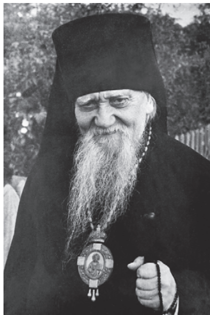
Епископ Афанасий (Сахаров)

В феврале 1925 года Владыка Афанасий вернулся во Владимир, где продолжил борьбу за чистоту веры и священных канонів. В следующем году его вновь ненадолго арестовали за проповедь, в которой он призывал не бояться преследований за веру. А в 1927 году арестовали как «участника группы епископов, использовавших Церковь в антисоветских целях», и приговорили к трём годам заключения в концлагерь. Наказание Святитель отбывал в Соловецком лагере особого назначения. По окончании срока его ожидала ссылка на три года в Туруханский край. В 1933 году Владыка Афанасий вернулся во Владимир, а в 1936 году был вновь арестован по нелепому обвинению в «связи с Ватиканом» и «белогвардейцами на Украине». Он отрицал все обвинения, объясняя, что не только ни с одним католическим священником, но даже и с рядовым католиком не был знаком. Несмотря на это последовал новый срок — пять лет лишения свободы, которые он отбывал в Беломорско-Балтийских лагерях. В начале Великой Отечественной войны Владыка Афанасий был этапирован в Онежские лагеря, весь путь в 400 километров он прошёл пешком, «неся на себе свои вещи». За этим последовала бессрочная ссылка в Омскую область. Находясь в ссылке, он пытался наладить церковную