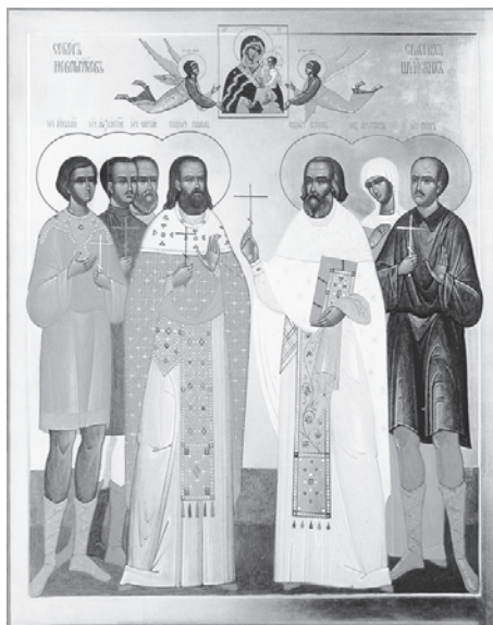
Святые Новомученики Шуйские. Икона

25 апреля 1922 года был оглашён приговор: протоиерей Павел Светозаров, священник Иоанн Рождественский и мирянин Пётр Языков были приговорены к расстрелу, четверо признаны невиновными, остальные приговорены к различным срокам тюремного заключения.