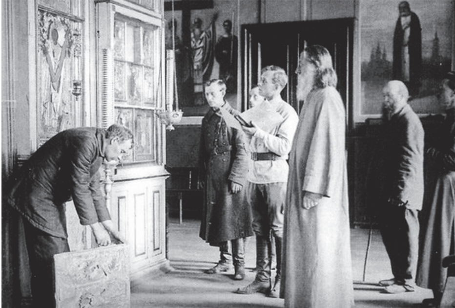
Во время кампании по изъятию церковных ценностей. Архивное фото

достояния от Церкви есть кощунственный захват и насилие. На каждом православном христианине, по самому званию его, лежит долг всеми доступными для него и не противными духу учения Христова средствами защищать церковные святыни от кощунственного захвата и поругания». Заканчивается определение словами: «Да будет ведомо всем, что Церковь Православная дорожит своими святынями по их внутреннему значению, а не ради материальной ценности, и что насилия и гонения бессильны отнять у неё главное сокровище — святую веру, залог её вечного торжества, ибо „сия есть победа, победившая мир, вера наша“ (1 Ин. 5, 4)».