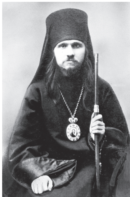
Архиепископ Фаддей (Успенский)

В марте 1922 года Преосвященный Фаддей прибыл в Москву. 13 марта Святейший Патриарх Тихон назначил его на Астраханскую кафедру с возведением в сан архиепископа, однако выехать в Астрахань Владыка не смог, находясь в Москве под подпиской о невыезде. Как уже говорилось, в мае 1922 года Патриарх Тихон, заключённый под домашний арест, был вынужден передать управление Православной Церковью митрополиту Агафангелу (Преображенскому). Лишённый властями возможности приехать в Москву, Владыка Агафангел составил послание к российской пастве с призывом хранить в чистоте устои Церкви и остерегаться тех, кто пытается незаконно узурпировать церковную власть. Два экземпляра послания он передал через священника, ехавшего в Москву, архиепископу Фаддею и протопресвитеру Димитрию Любимову. Вскоре за «распространение нелегально изданных посланий митрополита Агафангела» Владыка Фаддей был арестован и осуждён на один год ссылки в Зырянский край.