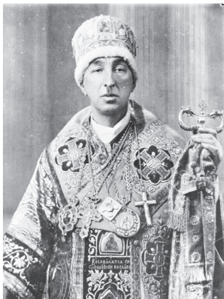
Лжемитрополит Александр Введенский

Как и предполагал Введенский, в глазах верных чад Церкви обновленцы так и остались убийцами. Много лет спустя одному юноше, увлеченному идеями Введенского, его знакомая сказала: «Я вас видеть не могу, на вас кровь митрополита Вениамина, если вы дружите с обновленцами». Каким было отношение к церковным «реформаторам» в 1922 году, свидетельствовали современники: «Настроение общин и народа очень враждебно новым лицам, пришедшим на смену Патриарху. Своё выражение оно получило на публичных диспутах, которые попыталась устраивать „инициативная группа“ для пропаганды новой церковной политики... Доклады священников и прения протекали при непрерывных скандалах. По адресу „инициативной группы“ всё время неслись крики: „предатели“, „иуды“, „убийцы“, „сколько платит вам чрезвычайка?“».