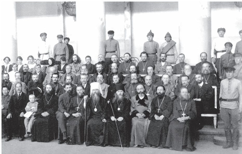
Скамья подсудимых на петроградском процессе. Архивное фото

Приговор Петроградского ревтрибунала вызвал большое количество ходатайств о помиловании. Испугавшись осуждения и гнева народного, выступили с ходатайством о помиловании и обновленцы, наглые